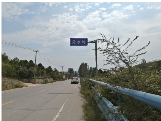
图 2 南召县皇后乡分水岭村分水岭

桥。村旁为古三鸦路口” ① 。说明这是古三鸦路所经之地。具体而言,鲁阳关在今属南阳市南召县皇后乡分水岭村,北鲁阳北关约在分水岭北四十里铺与五里铺间对角沟的地方,即“南召县鲁阳关—楚长城遗址”处(图 3),横跨灋河(北鲁阳关水)河谷;南关约在分水岭南,横跨鸦河(南鲁阳关水)河谷。实地考察可见,今北鲁阳关处灋河谷地两岸丘山对峙绵延,灋河溪水汨汨南流,山丘树木茂盛,楚长城遗迹掩映其中,今焦柳铁路与薄原线公路夹河谷西东绕行,实为置关守险之处。就地址而言,分水岭及两侧的南北鲁阳关今都属南召县了,我们仍然说鲁阳关,只是延续历史上的惯称。今走薄原线,从皇路店镇到北鲁阳关约 90 里,到分水岭南的第二鸦口即南鲁阳关约 80 余里,就是说第一鸦约有 80 里。二、三鸦口间约 10 里,自北鲁阳关到三鸦镇(今灋河乡)约 40 里,整个三鸦路实约有 130 里。这与前述徐少华的观点略有出入,实地行走薄原线,皇路店镇北到云阳镇就约有 60 里(参见图 4)。