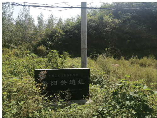
图 1 鲁山县灋河乡灋西村所谓的“鲁阳关遗址”碑

三是认为鲁阳关包括三关。鲁山县人民政府 2005 年所立平顶山市文物保护单位鲁阳关遗址碑介绍说,鲁阳关“即为楚长城记载‘鲁关’,其一关至三关为鲁阳关水(又称鸦水、鸦路)道,为楚国到鲁阳再北抵洛阳的咽喉峡谷,三关之间峡长 50 华里。今焦枝铁路、豫 02 公路经此。第二关交口为楚长城遗迹干线所经处,列入《楚长城遗址》另述。本关为鲁阳第三关。2004 年 10 月 29 日平顶山市人民政府公布为市级文物保护单位”。豫 02 公路即河南 S231 省道。据标识碑所在地,第三关约在昭平台南干渠灋河渡槽与薄原线(河南 S231 省道)交叉口东南,属于灋河乡灋西村,据说遗址稍东就是刘秀寨(图 1)。据 2013 年 7 月 3 日河南省人民政府所公布的南召县鲁阳关楚长城遗址标识牌所在地,第二关约在薄原线四十里铺与五里铺中间,大致在两者之间对角沟的地方。第一关所在地未作说明。据薄原线上第二、三关所在地间大约 19 公里的里程来看,第一关所在地大致在皇后山北 6 公里左右的地方。