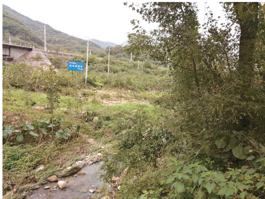
图 3 南召县皇后乡分水岭村“南召县鲁阳关——楚长城遗址”(北鲁阳关)处

桥。村旁为古三鸦路口” ① 。说明这是古三鸦路所经之地。具体而言,鲁阳关在今属南阳市南召县皇后乡分水岭村,北鲁阳北关约在分水岭北四十里铺与五里铺间对角沟的地方,即“南召县鲁阳关—楚长城遗址”处(图 3),横跨灋河(北鲁阳关水)河谷;南关约在分水岭南,横跨鸦河(南鲁阳关水)河谷。实地考察可见,今北鲁阳关处灋河谷地两岸丘山对峙绵延,灋河溪水汨汨南流,山丘树木茂盛,楚长城遗迹掩映其中,今焦柳铁路与薄原线公路夹河谷西东绕行,实为置关守险之处。就地址而言,分水岭及两侧的南北鲁阳关今都属南召县了,我们仍然说鲁阳关,只是延续历史上的惯称。今走薄原线,从皇路店镇到北鲁阳关约 90 里,到分水岭南的第二鸦口即南鲁阳关约 80 余里,就是说第一鸦约有 80 里。二、三鸦口间约 10 里,自北鲁阳关到三鸦镇(今灋河乡)约 40 里,整个三鸦路实约有 130 里。这与前述徐少华的观点略有出入,实地行走薄原线,皇路店镇北到云阳镇就约有 60 里(参见图 4)。